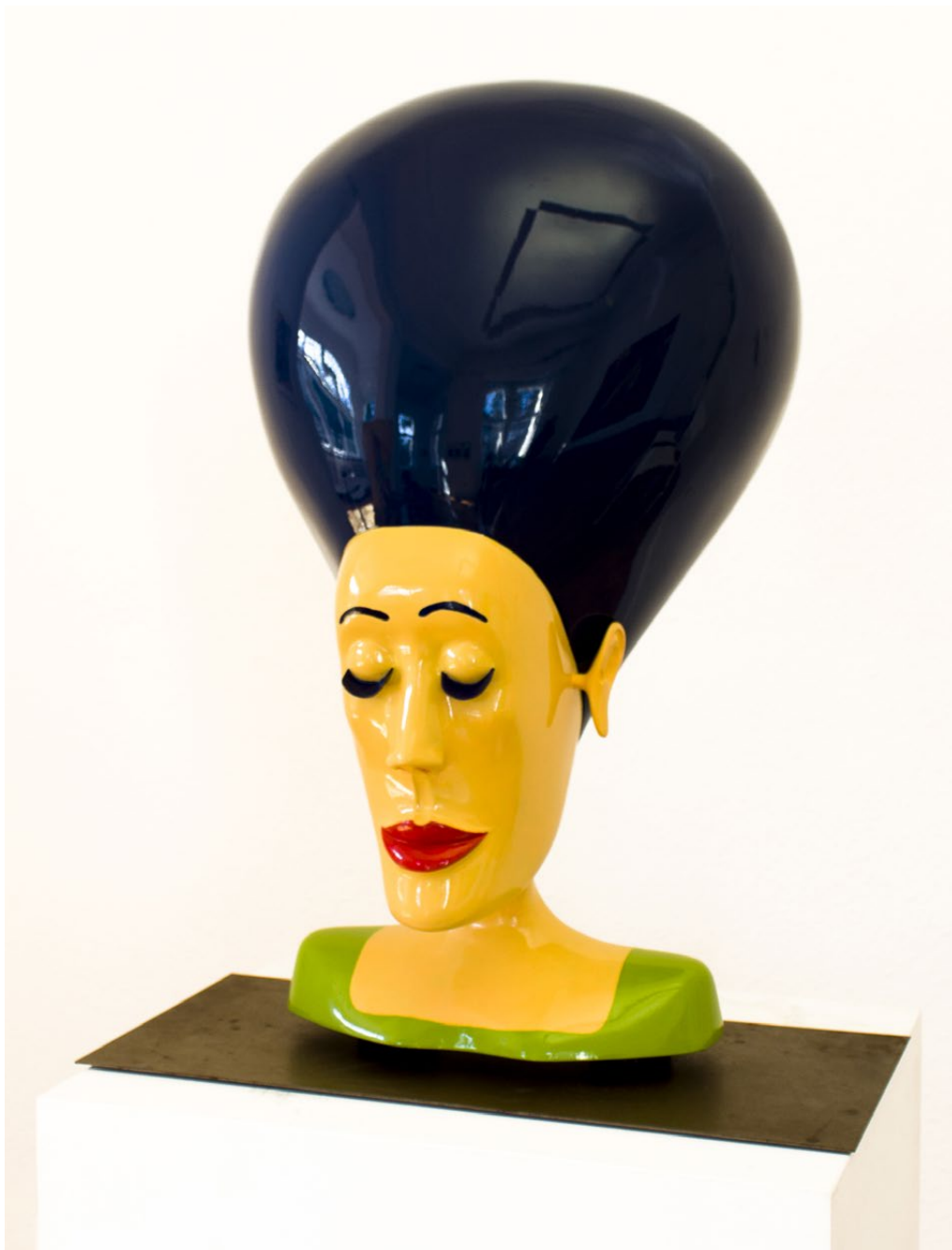
BUST (EXOTIC) | HÖHE CA 60 CM, 2005 / 2015, LINDENHOLZ BEMALT

Die starkfarbigen, an die Pop-Art erinnernden Skulpturen des Künstlers ironisieren das Erhabene und sich wichtigtuerisch Gebende.