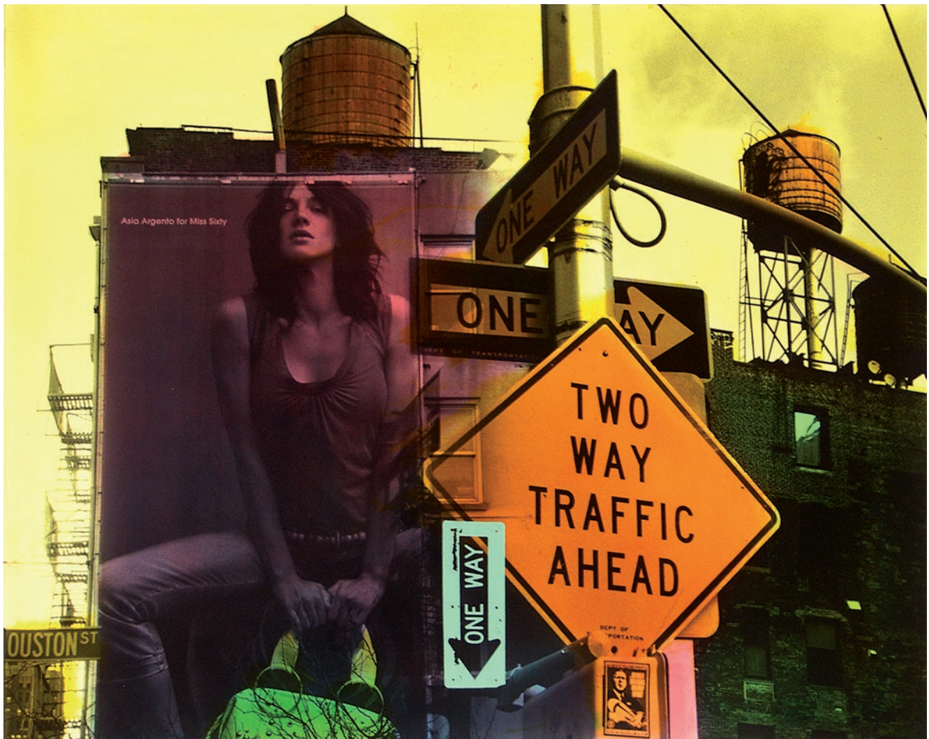
TWO WAYS – 120 X 150 CM

Helle Jetzigs Bilder sind Kombinationen von Malerei, Fotografie und Druckgrafik. Ihre faszinierend-rätselhafte Wirkung erhalten die Bilder unter anderem durch zahlreich geschliffene Lackschichten.