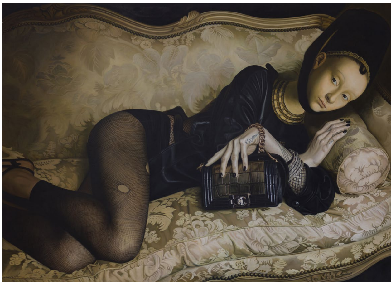
MADONNA 13 | 2014, 150 X 210 CM, ÖL AUF LEINWAND

Jannis Markopoulos beschäftigt sich mit dem modernen Frauenbild. Seine Portraits zeigen ein zwiespältiges Verhältnis zum eigenen Körper.