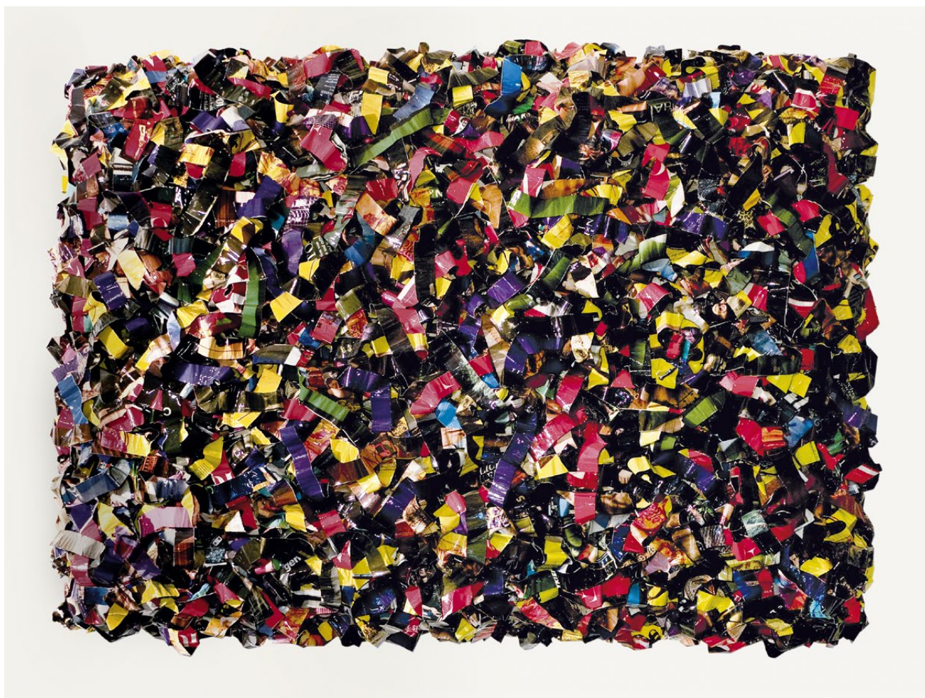
OBJEKTBIKD B-I/4-2013 | MAGAZINE, KUNSTHARZ AUF ALU-RAHMEN MIT DRAHTGEFLECHT, 100 X 135 X 30 CM