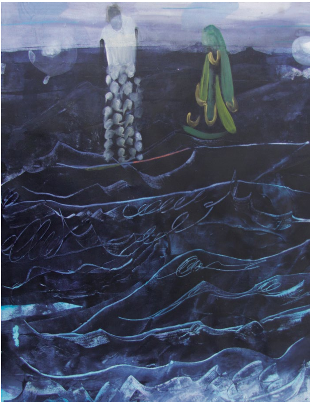
NO ONE'S WATCHING | 2014, ACRYL AUF PAPIER, 76 X 54 CM

Als roter Faden führt das Thema Mensch und Natur durch das Werk. Die Poesie eines einfachen, eng mit der Natur verbundenen Lebens scheint auf.