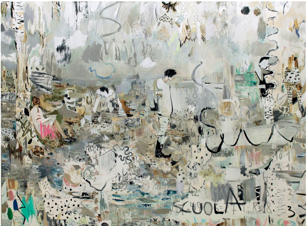
class bunkers | 2016, Mischtechnik / Lw, 200 x 270 cm