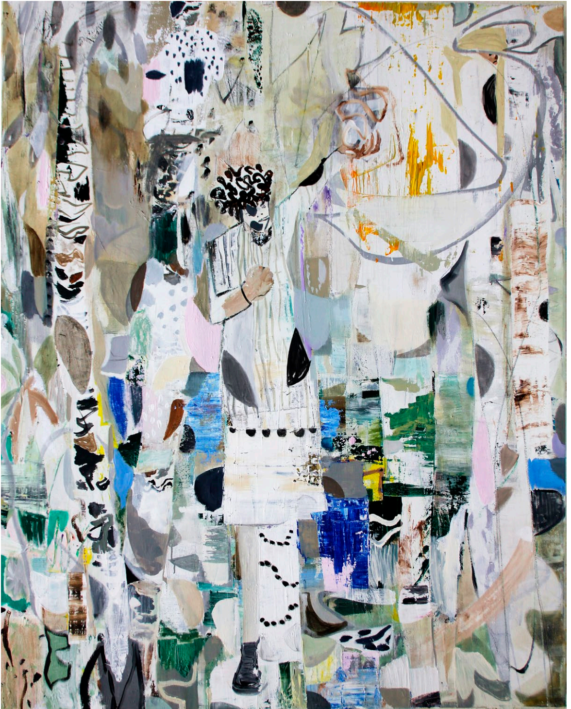
Hold On | 2017, Mischtechnik / Lw. 150 x 130 cm