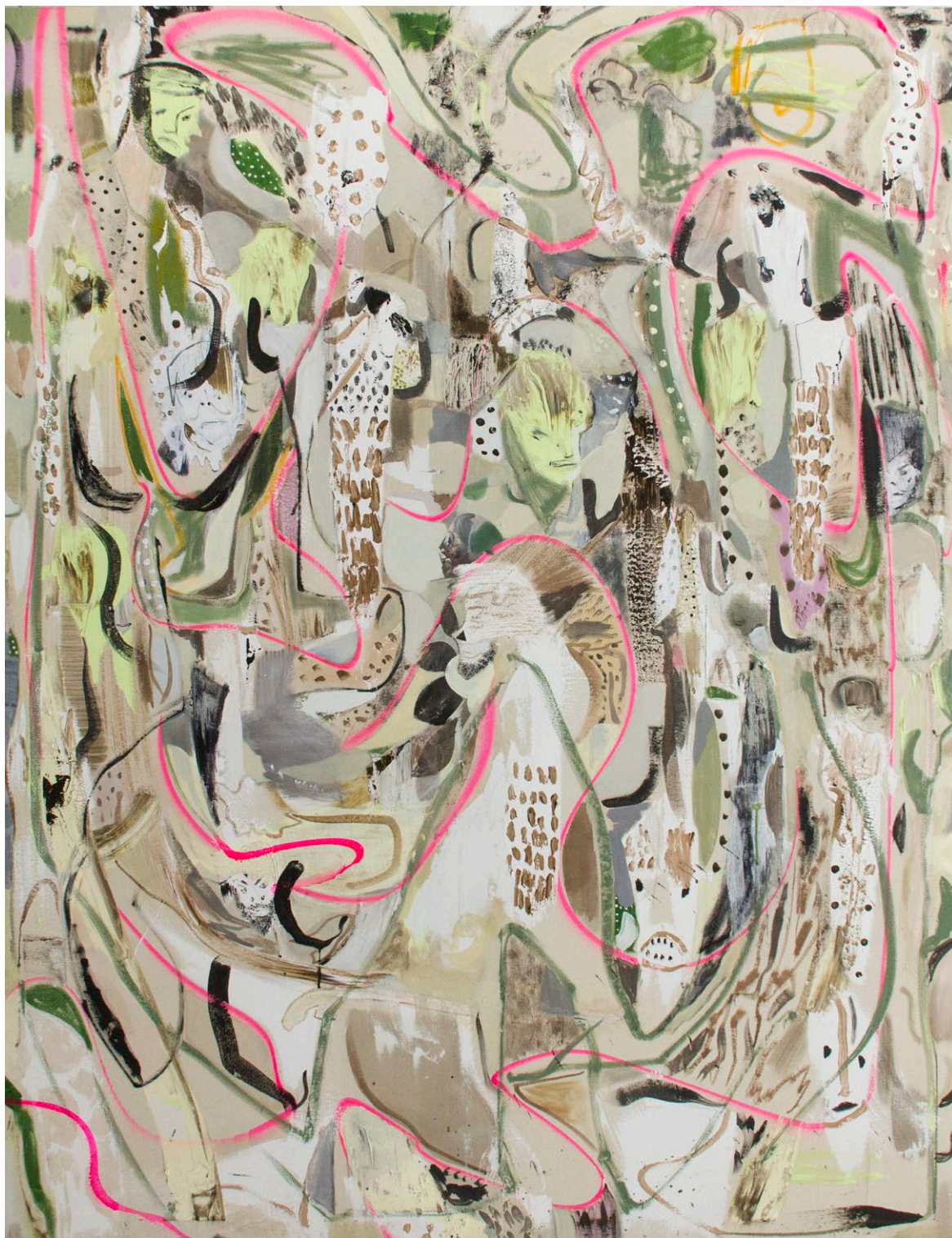
every dream a trap | 2017, Mischtechnik / Lw. 200 x 150cm

Vernissage 05.05. | 19-22 h Ausstellung 06.05.-10.06.17