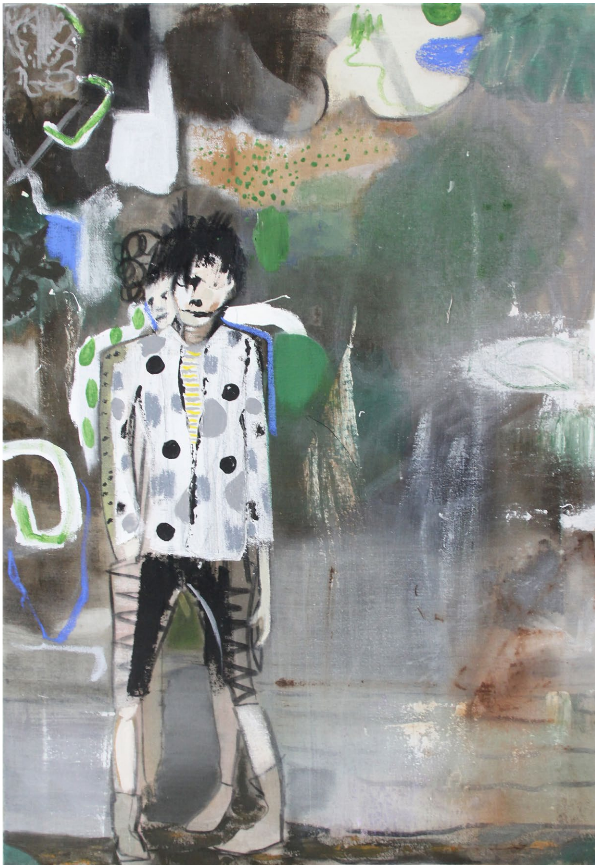
Sid & Nancy | 2017, Mischtechnik / Lw. 85 x 60 cm