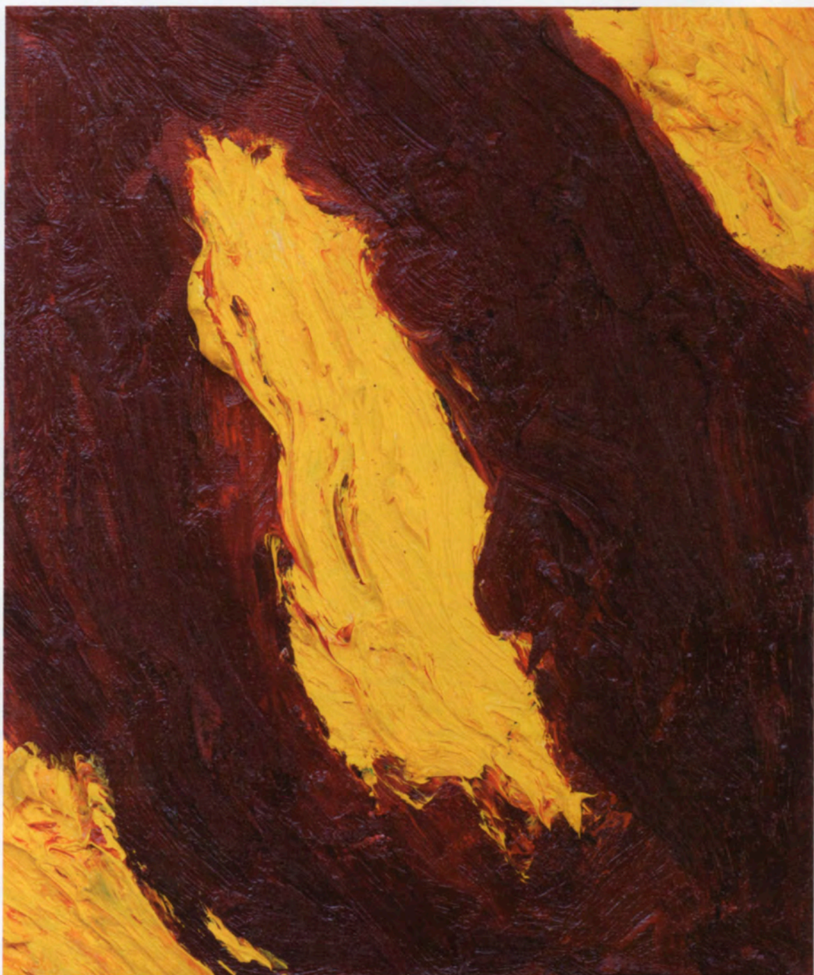
Marrakesh II, 2015, olieverf op doek, 50 x 40 cm