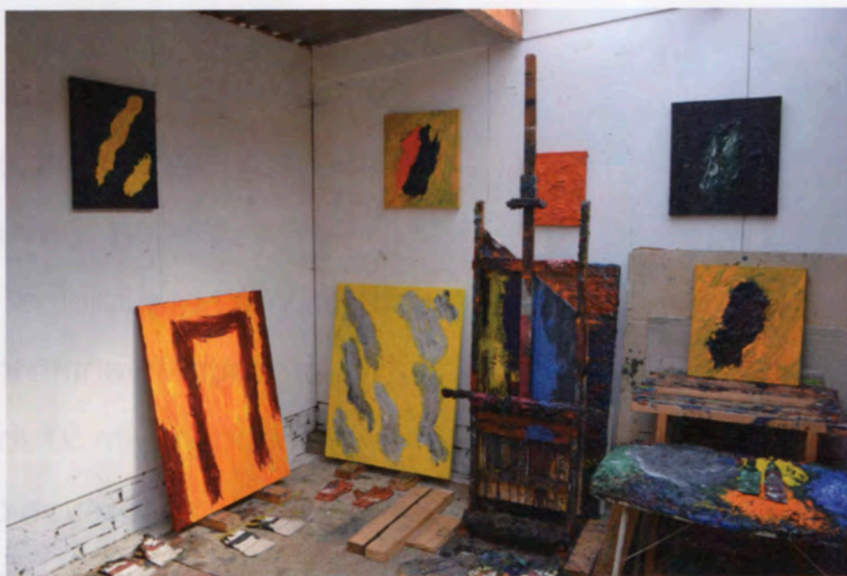
Het atelier van De Beus met op de grond 'De kleine kamer' (links) en 'Gas!' (rechts), 2015, olieverf op doek, 100 x 80 cm