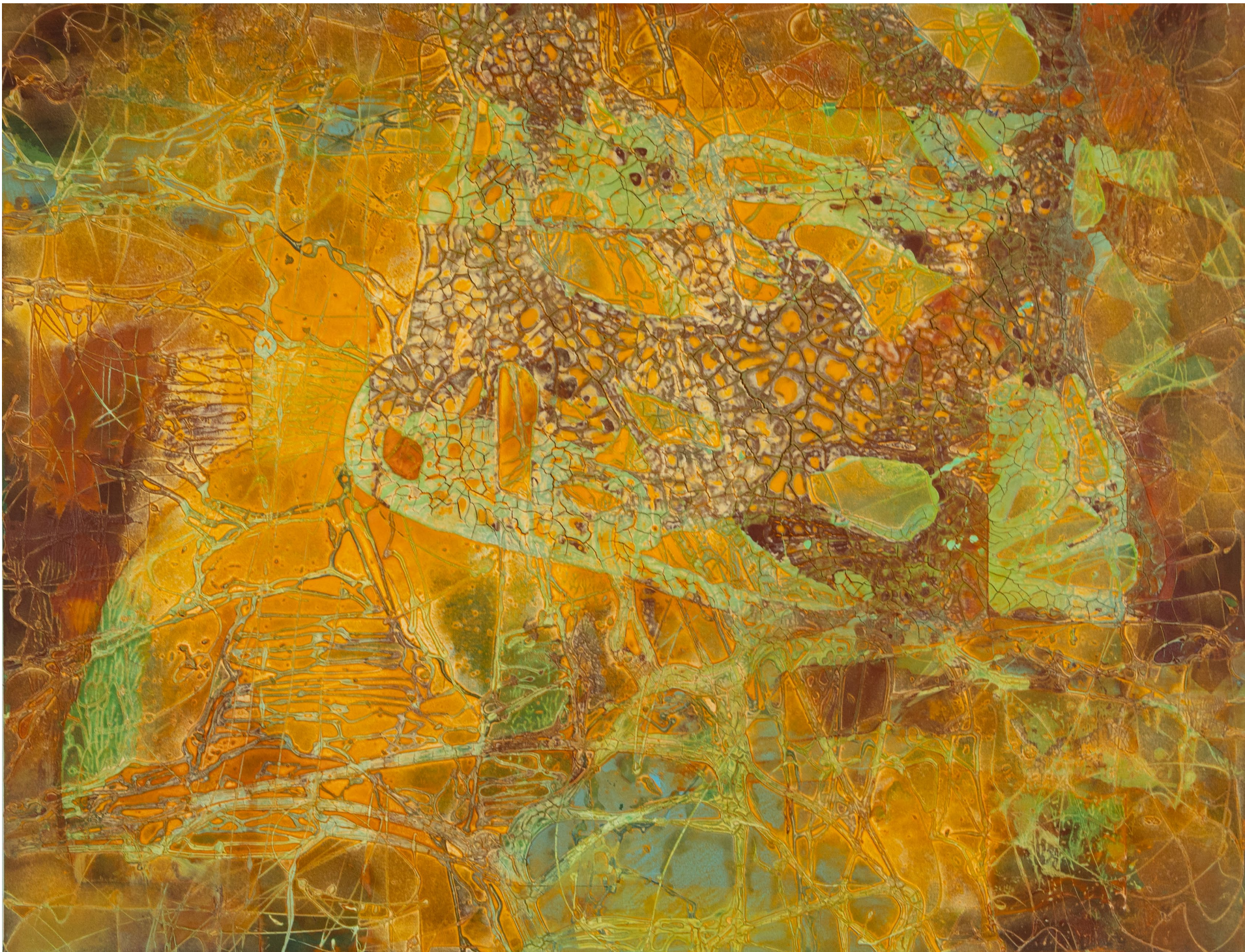
Auf Felsen erblüht es 1 | Mischtechnik auf Leinwand, 2025, 100 x 130 cm