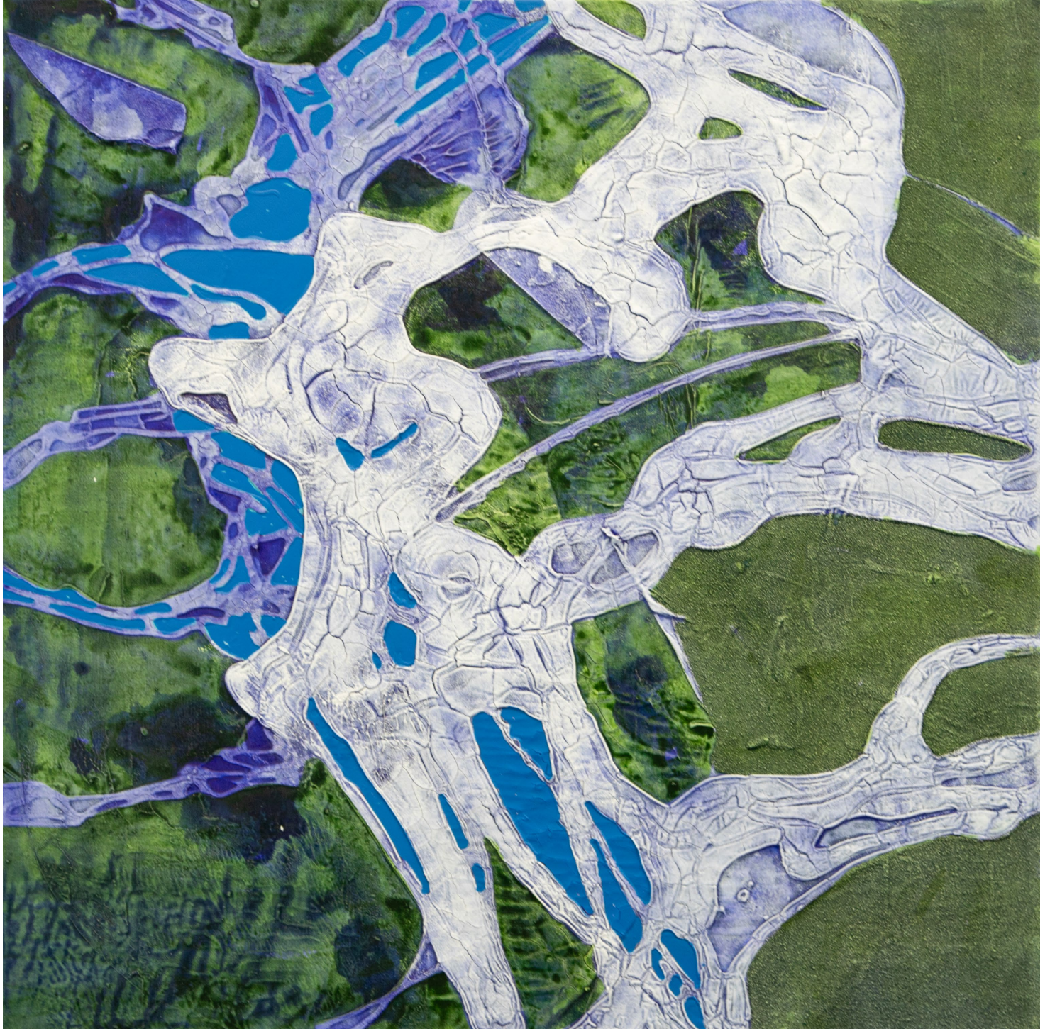
Gegeneinander mäandernd | Mischtechnik auf Leinwand, 2026, 80 x 80 cm