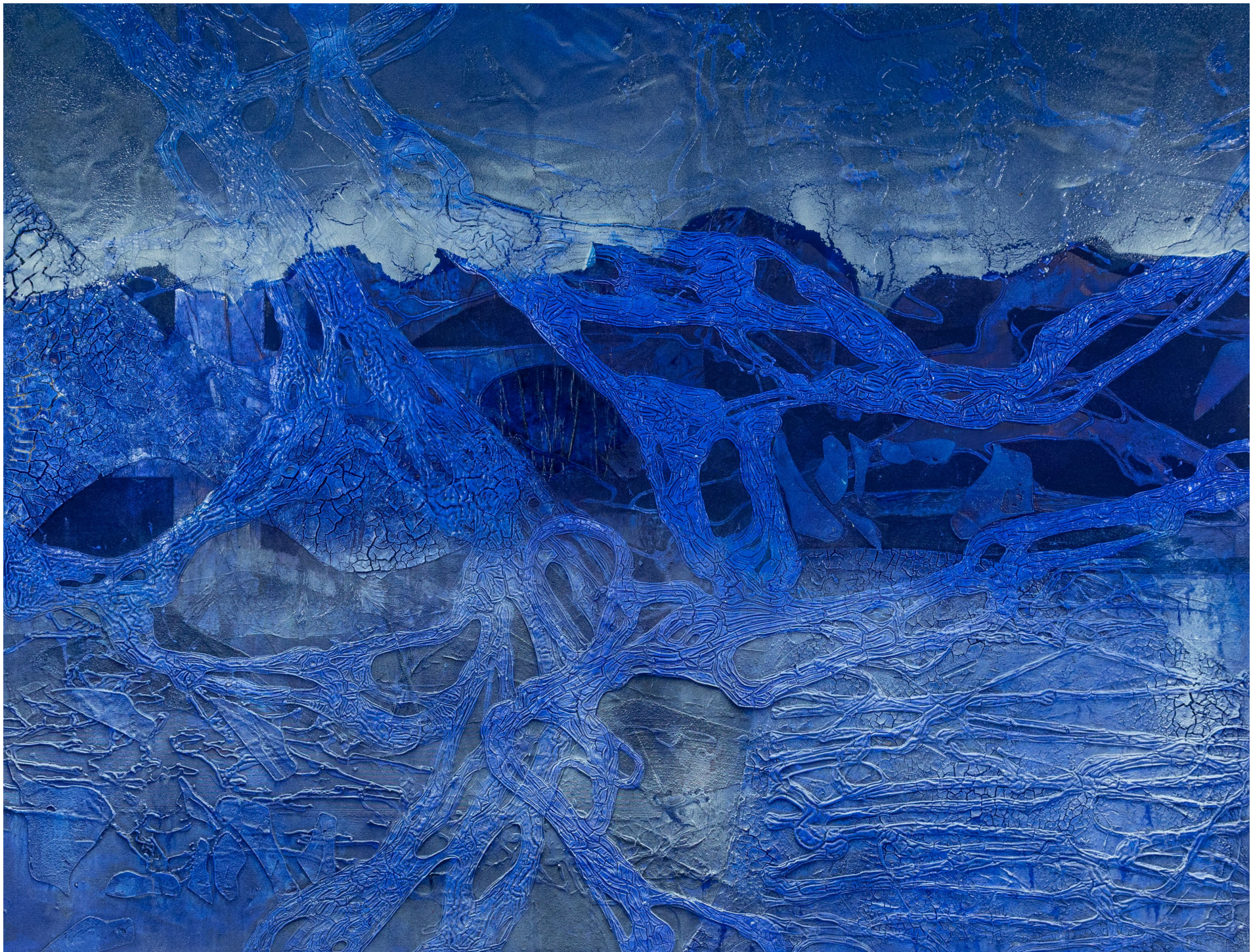
Mystisches Blau | Mischtechnik auf Leinwand, 2025, 130 x 170 cm